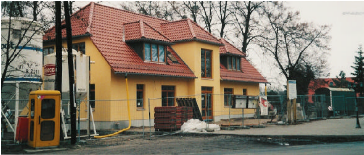
Das neue Gemeindehaus