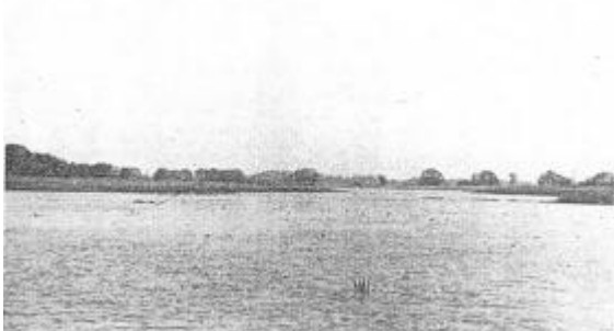
Der Wublitzsee im Jahr 1935

Aus allen diesen Entwicklungsphasen entlang der Wublitzrinne zeugen Keramik-, Metall- und Knochenfunde. Die ersten Spuren der Besiedlung entdeckte man bereits im 19. Jahrhundert. Werkzeuge, Waffen und Hausrat wurden ausgegraben und sind heute in Museen und Ausstellungen zu besichtigen.