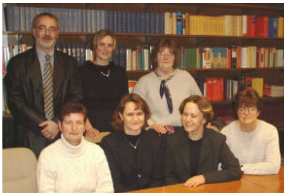
Der Vorstand des Heimatvereins MEMORIA Priort i.G.