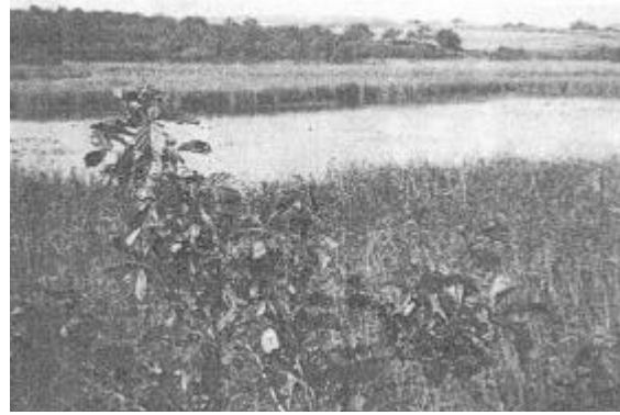
Der Wublitzsee im Jahr 1951