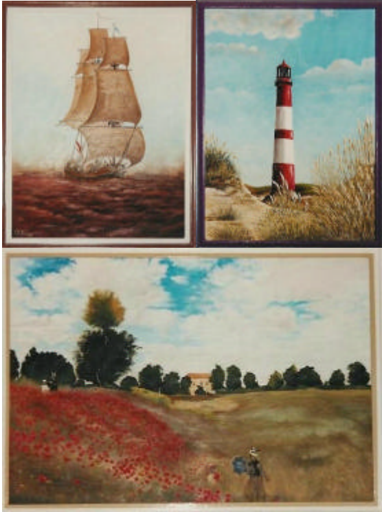
Bilder von Hans-Joachim Mertke Fotos: Manuela Vollbrecht