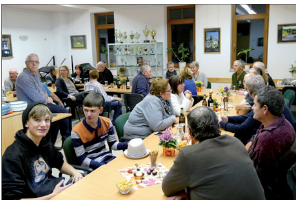
MEMORIA-Treff mit Vertreterm des Kleingartenvereins in Priort

Die Gestaltung der Priorter Ortsmitte war sowohl zeitlich als auch materiell sehr aufwendig. In unzähligen Abstimmungen und Treffen mit der Präsentation von Ideen und Entwürfen haben viele Priorter ihre Vorstellungen einbringen können. Umso mehr haben wir uns darüber gefreut, dass dieser Platz nun so großen Anklang findet. Ich habe schon oft gesehen, wie Leute vor den Schautafeln stehen oder auf der Bank eine Pause einlegen.