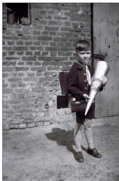
5. August 1942: Der erste Schultag

Von den schlimmen Ereignissen der NS-Zeit bekamen wir Kinder erst später etwas mit, wir hatten viele Bewegungsmöglichkeiten und nutzten sie. Inzwischen war Krieg und da auf dem Bornstedter Feld