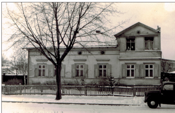
Das Elternhaus in Potsdam, Kirschallee 1

marschierten und ihre Marschlieder sangen: „Auf der Heide blüht ein blaues Blümelein...“. Schräg gegenüber – früher Bornstedter Feld mit Blick bis zum Belvedere auf dem Pfingstberg – war vor meiner Geburt ein riesiger Kasernenkomplex gebaut worden, von uns „Kriegsschule“ genannt, einige Häuser weiter auch moderne Offizierswohnungen. Uns Kinder interessierten aber mehr die Bäckerei nebenan, die Haustiere der Nachbarn, die Schmiede mit Schaukeln, abgewrackte Autos, das Wechseln der Hufeisen der Pferde. Auch unser „Biohof“ mit Pächters Hühnern, Plumsklo, Wasserhahn war wichtig.