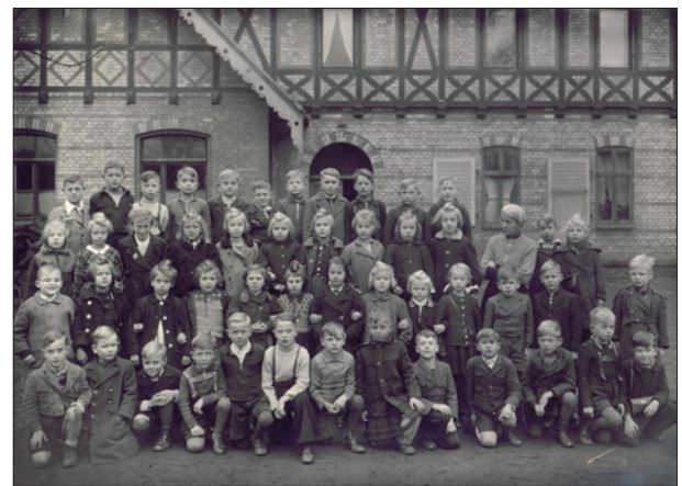
In der Schule in Bornstedt

Unser Vater war im Herbst aus Kriegsgefangenschaft entlassen worden und fing in der Kaserne, jetzt von den sowjetischen Soldaten benutzt, als Heizer an. Er bekam dort Essen und konnte altes Brot mitnehmen, sodass wir kaum gehungert haben. Unsere