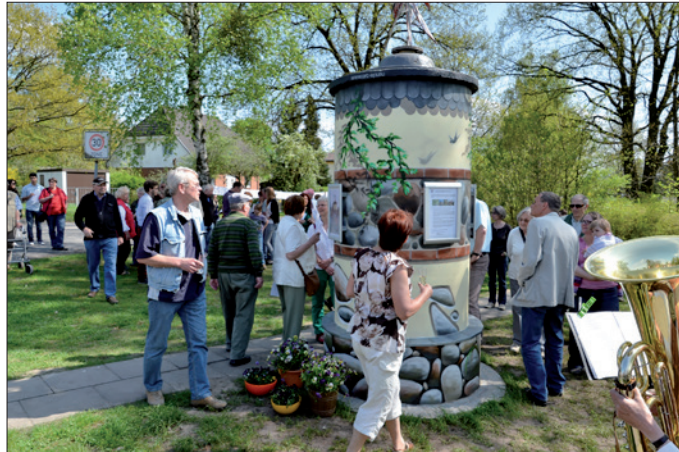
Ein Höhepunkt von MEMORIA: Einweihung der neuen Priorter Litfasssäule im Mai 2013

Laut Satzung sind die Vereinszwecke die Förderung der Kultur sowie der Bindung zur Heimat, die Dokumentation der Ortsentwicklung gestern und heute und die Veröffentlichung dieser Ergebnisse in