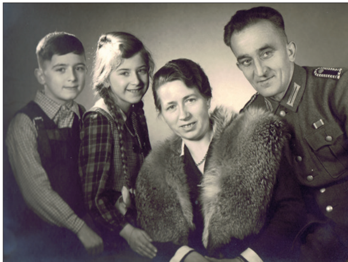
Im Januar 1945 mit Vater auf Urlaub

Unsere Mutter – ich hatte noch eine etwas ältere Schwester – war eine der Töchter eines Bergmann-Ehepaares in der Salzstadt Staßfurt. Dort war sie nach der Schule als Dienstmädchen bei einem Uhrmacherpaar „in Stellung“ und daraus wurde eine lebenslange Freundschaft mit dem Uhrmacher, der bald Witwer und kinderlos war. Er war ein begeisterter Wanderer und auch Bastler und uns Kindern später fast ein Großvater. Ein Besuch bei den Eltern unserer Mutter schloß auch immer den Besuch bei „Onkel Schlanze“, seinem Heim und Werkstatt mit ein. Denn im Dienste einer adeligen Familie in Pots-