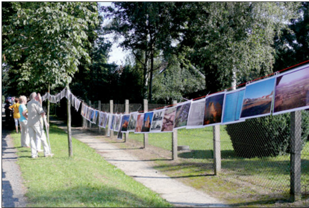
Die Priorter Kulturwäscheleine anlässlich 10 Jahre MEMORIA im September 2011

Nach dem Auslaufen dieser Stelle nahm sich MEMORIA des Projektes an und vollendete es mit Unterstützung des Amtes. Die damals entstandenen Texttafeln hat der Verein in den letzten anderthalb Jahren umfänglich überarbeitet, ergänzt und zu modernen Aufstellern erneuert. Eine Erweiterung dieser Ortsinformationen zu historischen Gebäuden/Plätzen in der Priorter Siedlung ist für die nächsten beiden Jahre geplant.